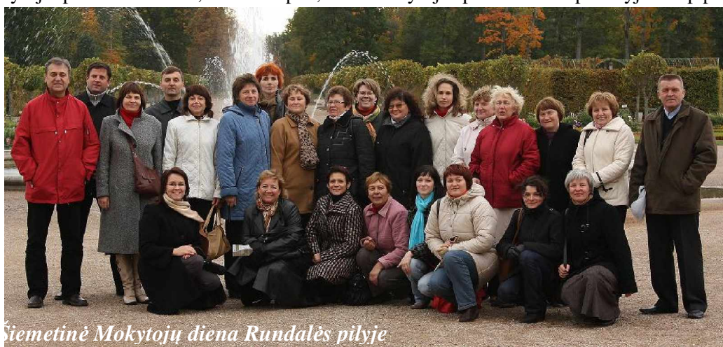
Šiemetinė Mokytojų diena Rundalės pilyje

Tikimės, kad ši mūsų mokyklos ilgametė tradicija gyvuos dar ilgai ilgai.