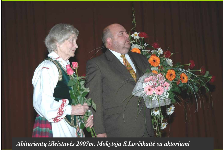
Abiturientų išleistuvės 2007m. Mokytoja S.Lovčkaitė su aktoriumi

Mokykla - visų pirma, tai mokytojas ir mokinys. Jų interesų, veiklos tikslų, metodų santykio realizavimas. Kas