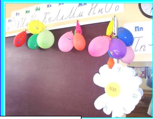
Pasaulyje nėra nieko gražesnio už dorą žmogų. R.Rolanas