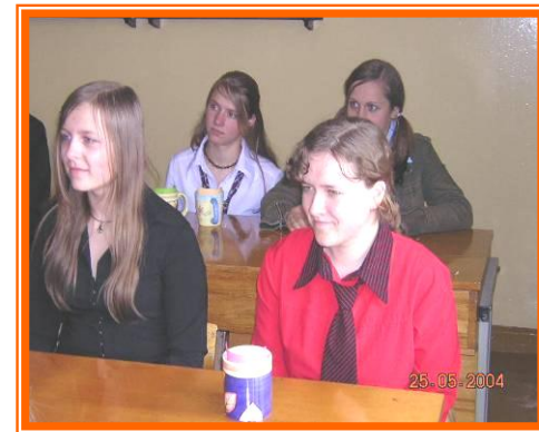
Gyvenimas – ne tos dienos, kurias praėjo, o tos, kurias atsimeni. P.Pavlenka