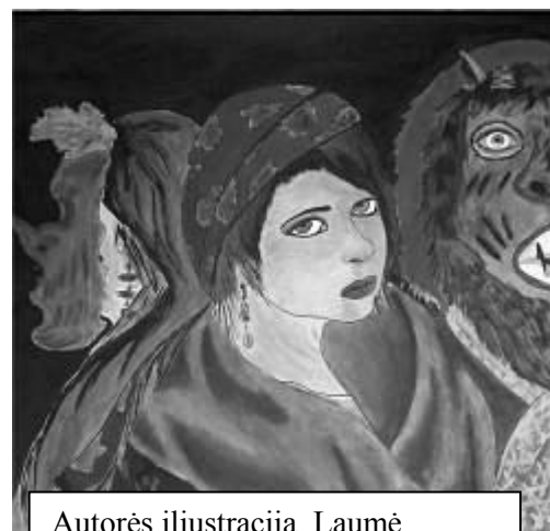
Autorės iliustracija I. I. I. I. I.

Kai baigiau darbą, jau švito, atsitiesusi susižėriau lapelius į sterblę ir atvėrusi langą išpyliau lauk, leisdama rytiniam žvarbiam vėjeliui nunešti juos tolyn, pažerti gatvėje praeiviams po kojomis.